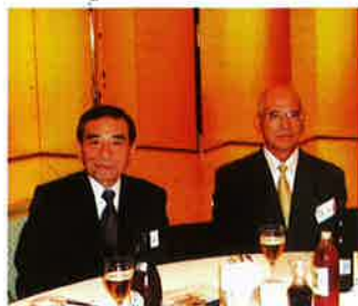
岡会長(左)と加野校長先生(右)