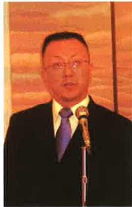
司会は大変でした