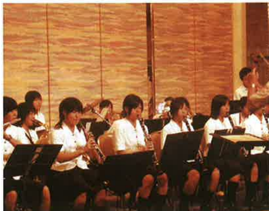
今年も吹奏楽部がゲストで参加