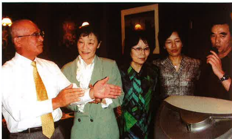
加野校長先生と談笑する当番幹事の16回生のみなさん