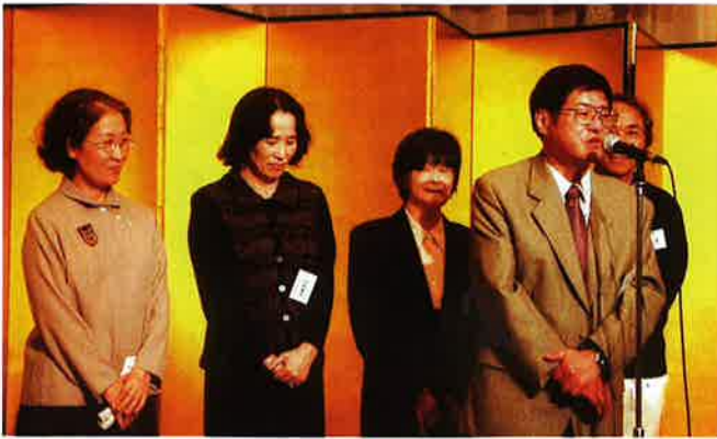
来年度の東京支部当番幹事の17回生のみなさん