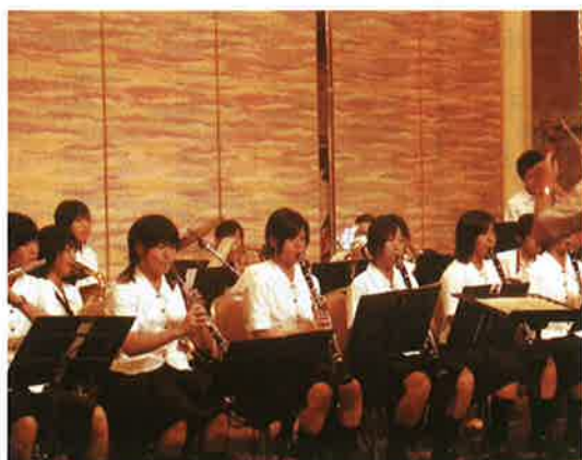
今年も吹奏楽部がゲストで参加