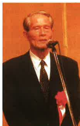
岡部東京同窓会会長あいさつ