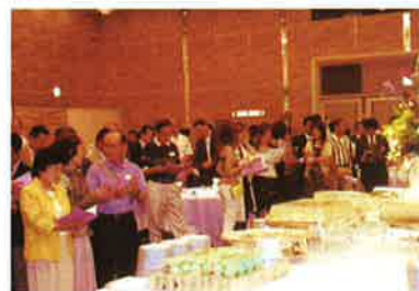
校歌は忘れていません