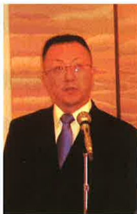
司会は大変でした