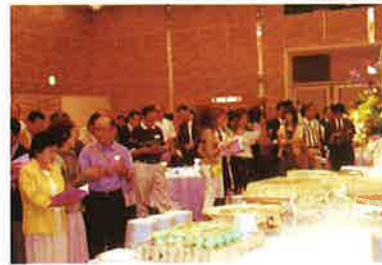
校歌は忘れていません