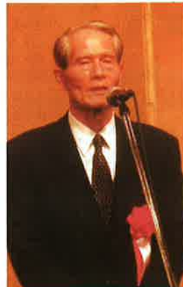
岡部東京同窓会会長あいさつ