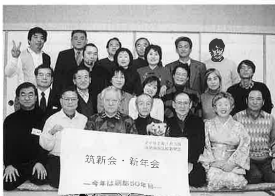
新聞部が創部50年目を迎える!! (OB会(筑新会)が記念祝賀会を開催)