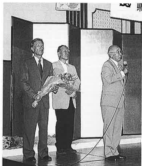
△退任された(右から)村田会長、政住、松下両副会長